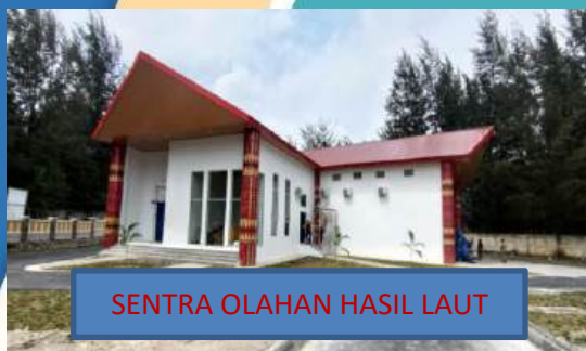
SENTRA OLAHAN HASIL LAUT

DINAS TENAGA KERJA, PERINDUSTRIAN DAN PERDAGANGAN KABUPATEN BANGKA